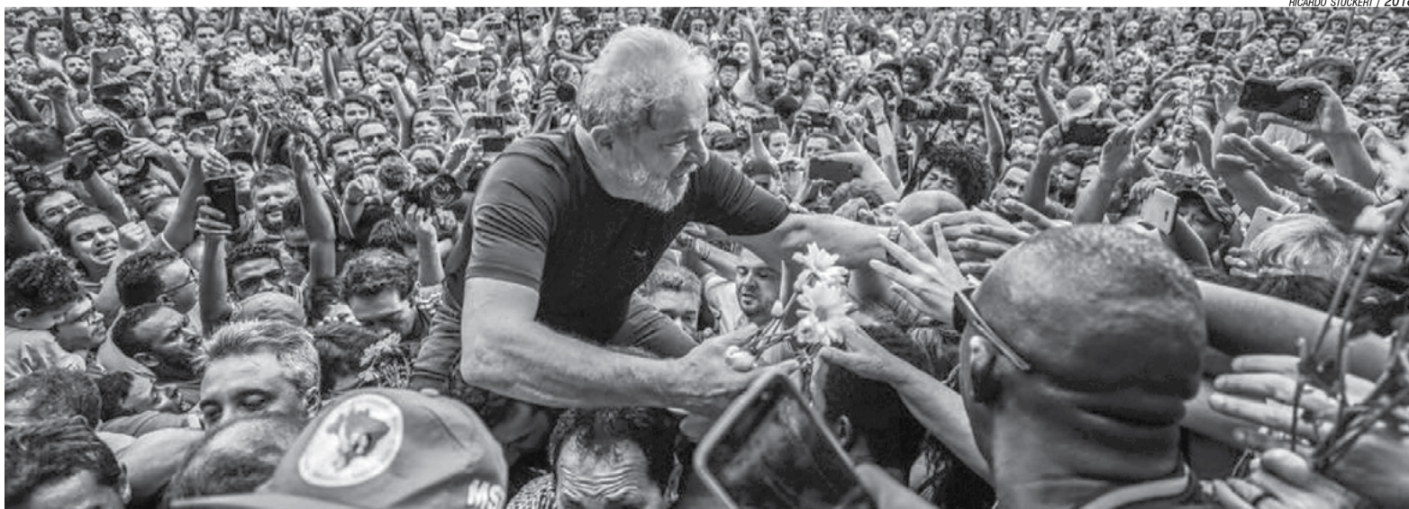
RICARDO STUCKERT / 2018